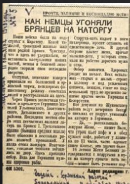
Статья из газеты «Брянский рабочий» от 11 октября 1943 г. № 5 «Как немцы угоняли брянцев на каторгу»