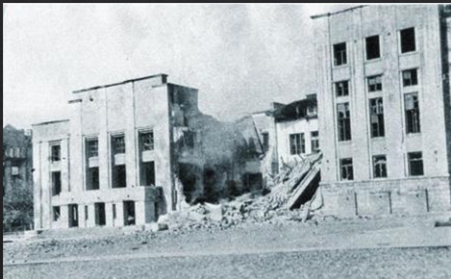
Взорванный театр им. Маяковского в г. Брянск