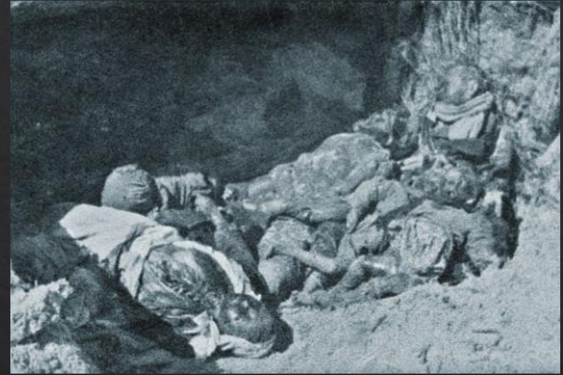
Деревня Устарь Суземского района. Жертвы немецко-мадьярских карателей