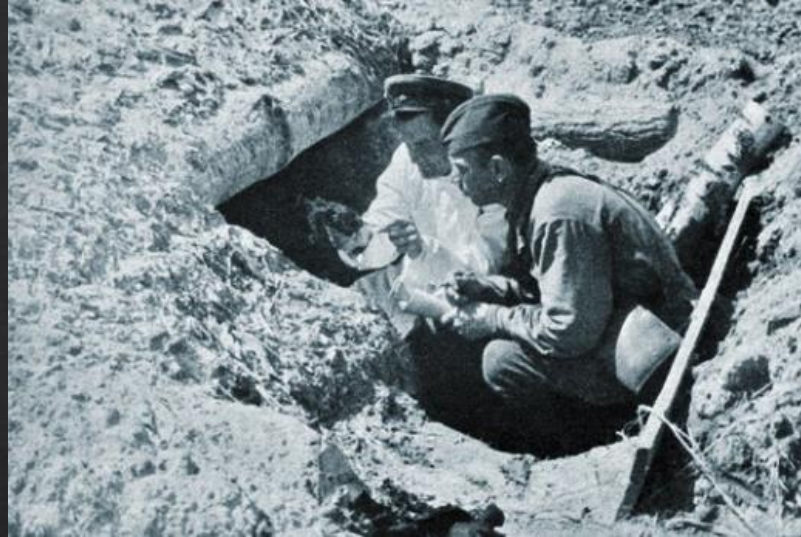
Главный хирург партизанской бригады «За власть Советов» и представитель Штаба Южного партизанского края изучают факт применения карателями боевого отравляющего вещества против мирных жителей д. Устарь Суземского района