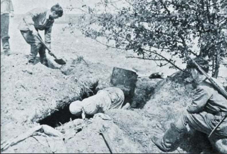
Вскрытие подвала, где были отравлены газами мирные жители д. Устарь Суземского района