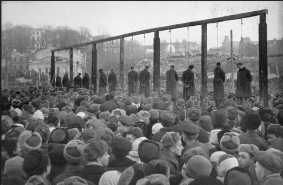
Казнь фашистских преступников в Киеве февраля 1946 года