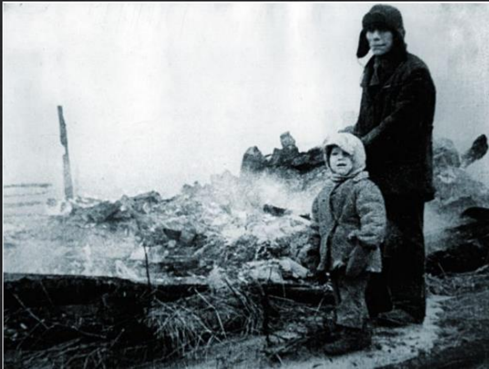
Жители сожженной д. Устарь Суземского района