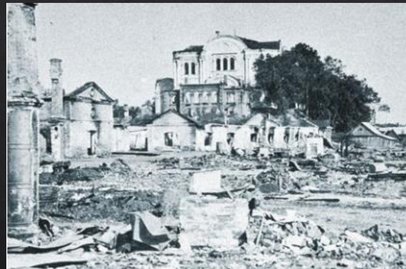
Разрушенная набережная в г. Брянск