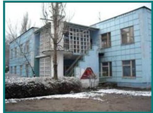
Типичное здание детского сада в странах СНГ

АГБ выступила с инициативой создания муниципального револьверного фонда под названием Специальный расчетный счет (СРС) в рамках ДЖКХ и ТЭЦ. СРС был создан в соответствии с положением «О формировании и расходовании средств СРС в целях энергосбережения», которое было подготовлено Финансовым департаментом и утверждено мэром г. Бишкека. В положении были определены правила функционирования СРС, описан порядок формирования фонда, процедуры отбора проектов и их финансирования; бюджетного планирования, процесса выделения средств и оплаты расходов по инвестициям; поддержания и сроков пополнения фонда; а также ведения СРС.