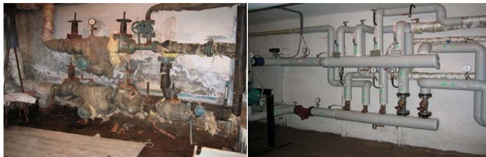
Теплоцентр до реализации проекта (слева) и после

Целевые револьверные фонды на северо-западе России и в Украине охватывают четыре различные программы, которые направлены на сокращение потребления энергии и воды в муниципальных зданиях, одной из которых является Программа энергосбережений. В рамках Программы энергосбережений (ПЭС), начатой в России в 1999 году, предоставляется финансирование на грантовой основе в размере до 50 процентов от стоимости проекта при условии, что остальные 50 процентов будут привлечены из местных источников и получены за счет сбережений по результатам реализации проекта и будут возвращены местному