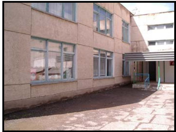
Детский сад No. 14 «Алтын балалык», г. Нарын, Кыргызская Республика

UNISON, Energy Consulting s.r.o. и ЭСКО выбрали муниципальный детский сад «Алтын балалык» в городе Нарын (Кыргызская Республика) для реализации демонстрационного проекта. В ноябре 2005 года был подписан четырехлетний ЭПК между «Алтын балалык» и ЭСКО. Кроме того, ЭСКО, детский сад и муниципалитет города Нарына подписали бюджетное соглашение до 2019 года с гарантированными сбережениями в объеме 20 процентов, по сравнению с базисом в 48120 Мкал в год. В соглашении говорится, что после реализации мер ЭЭ, администрация города Нарына обязана принять бюджет на такую же сумму, что и до осуществления проекта ЭЭ. Таким образом, энергосбережения, полученные в результате проекта, обеспечат детскому саду постоянный источник финансирования для будущих мероприятий по ЭЭ. По условиям соглашения ЭСКО также обязуется продолжать обслуживать установленное оборудование в течение всего срока осуществления проекта до 2019 года.