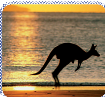
Осваиваем новые континенты! (стр. 4 - 5)