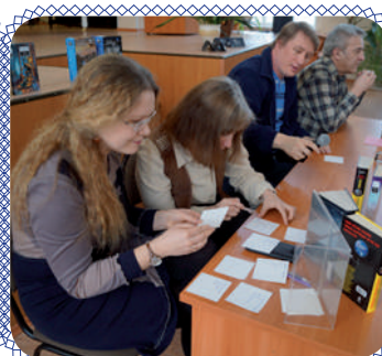
Экзамен для писателей (стр. 9)