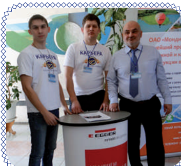
«Двойной выпуск»: итоги распределения (стр. 3)