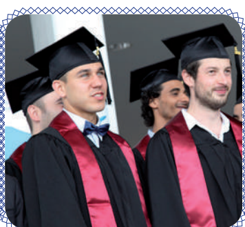
Новости из Безансона (стр. 7)