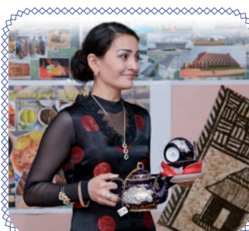
«Вкусный» конкурс (стр. 4)