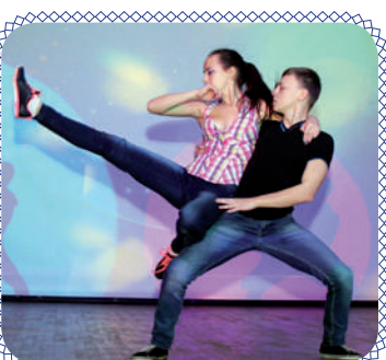
На сцене – энергетик! (стр. 10)