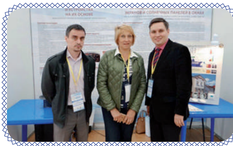
Инновации ИГЭУ на форуме в Плесе (стр. 4)