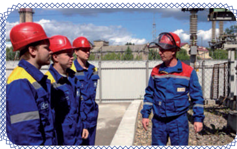
ССО: бойцы пишут домой (стр. 6 – 7)