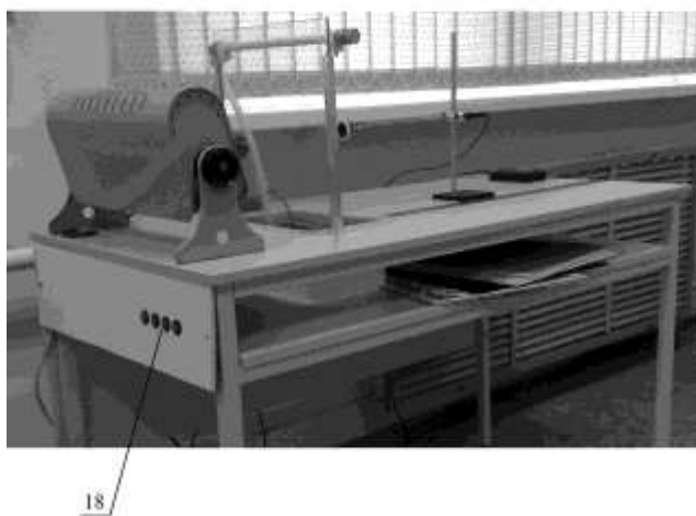
Рисунок 1. Внешний вид установки