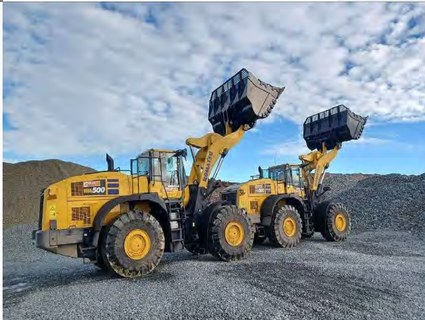
Ковши для погрузчиков