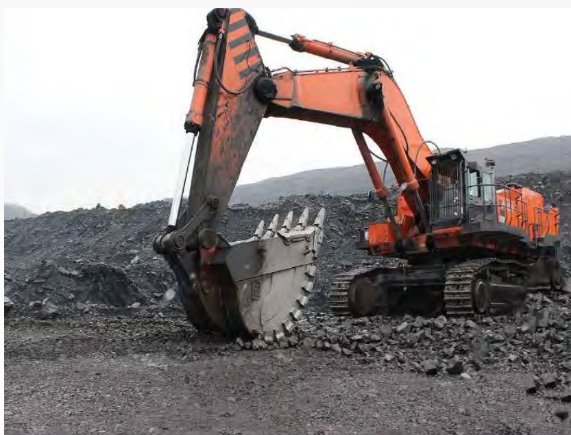
Ковши для экскаваторов